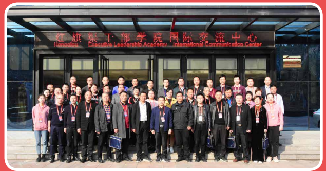
◎ 2019年福建省宁德市寿宁县党务干部赴红旗渠干部学院专题培训班（3月13日至17日）