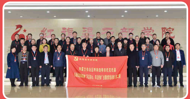
◎ 内蒙古自治区呼和浩特市托克托县主题教育培训班（2月24日至28日）