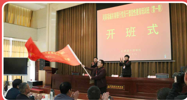
◎ 河南项城农商银行党员干部党性教育培训班（第一期）（3月15日至18日）