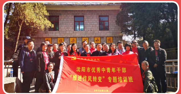
◎ 沈阳市优秀中青年干部“推进作风转变”专题培训班（3月29日至4月1日）