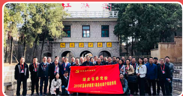
◎ 湖北省委党校 2019年春季学期第1期县处级干部进修班（3月25日至29日）