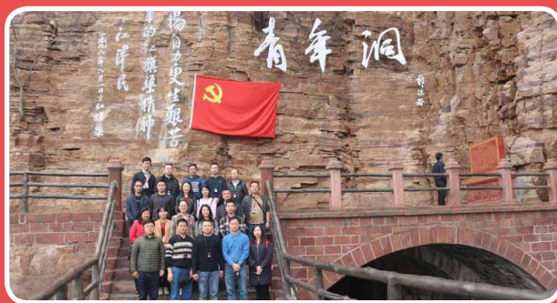
◎ 深圳市委外办赴河南红色教育培训班（3月17日至19日）