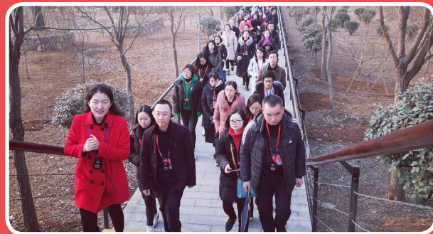
◎ 四川省泸州市干训工作者培训班（3月3日至7日）