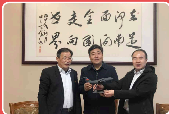
◎ 航空工业第一飞机设计研究院弘扬红旗渠精神，不忘初心、牢记使命专题培训班

为了进一步发挥“关键少数”的示范和表率作用，坚决贯彻落实好集团党组和飞机公司分党组各项部署，推动一飞院高质量发展，3月31日至4月1日，一飞院党委在我院举办了“弘扬红旗渠精神，不忘初心牢记使命”中心组扩大专题培训班，集中学习红旗渠精神。全体院领导、各机关部门负责人参加培训。