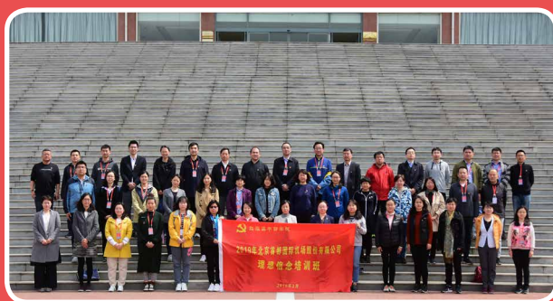
◎ 2019年北京首都国际机场股份有限公司理想信念培训班（3月25日至29日）