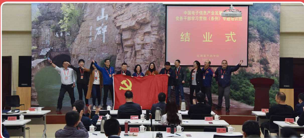
◎ 中国电子信息产业发展研究院党务干部学习贯彻《条例》培训班

期间，中国工程院院士、运-20运输机的总设计师唐长红，航空工业一飞院院长刘小锋向学院赠送了运-20飞机模型。