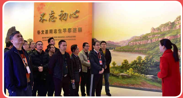
◎ 广东省英德市 2019 年纪检监察干部“锤炼党性修养 加强干部作风”专题培训班(3月29日至4月3日)