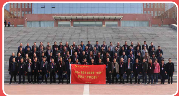
◎ 江苏省徐州新沂市“村书记论坛”(第三期)(3月8日至3月12日)