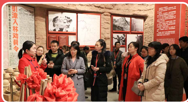
◎ 党性教育机构发展研讨班（2月25日至3月1日）