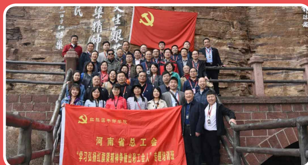
◎ 河南省总工会“学习弘扬红旗渠精神争做出彩工会人”专题培训班（4月1日至3日）