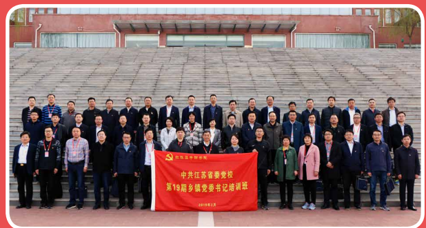
◎ 中共江苏省委党校第 19 期乡镇党委书记进修班(3月25日至28日)