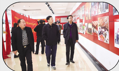
2月16日,河南省机关事务管理局副局长魏世春一行5人莅临学院考察。