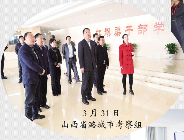
3月31日 山西省潞城市考察组