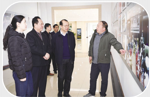
3月24日 广西省档案局考察组