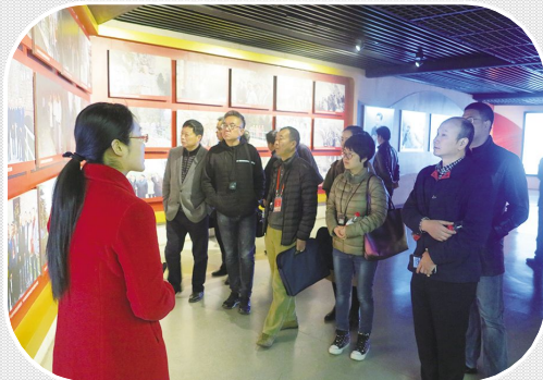
3月28日 湖南省委组织部考察组