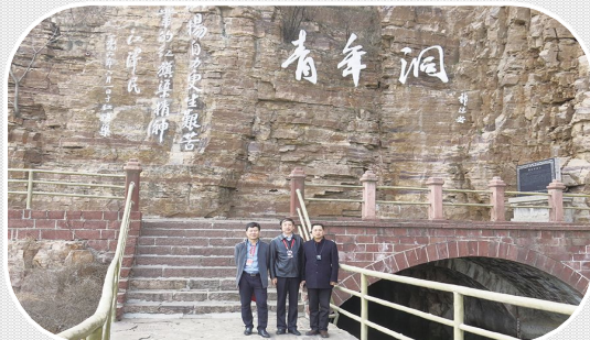
3月27日 江苏省省级机关工委考察组