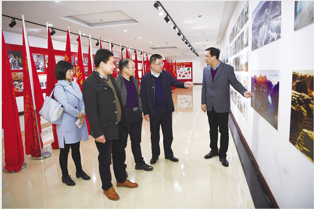
3月31日 湖北省襄樊老河口党校考察组