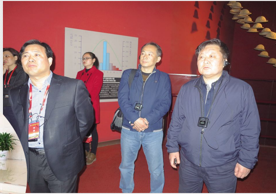
3月27日 陕西省西安市文化广电新闻出版局考察组