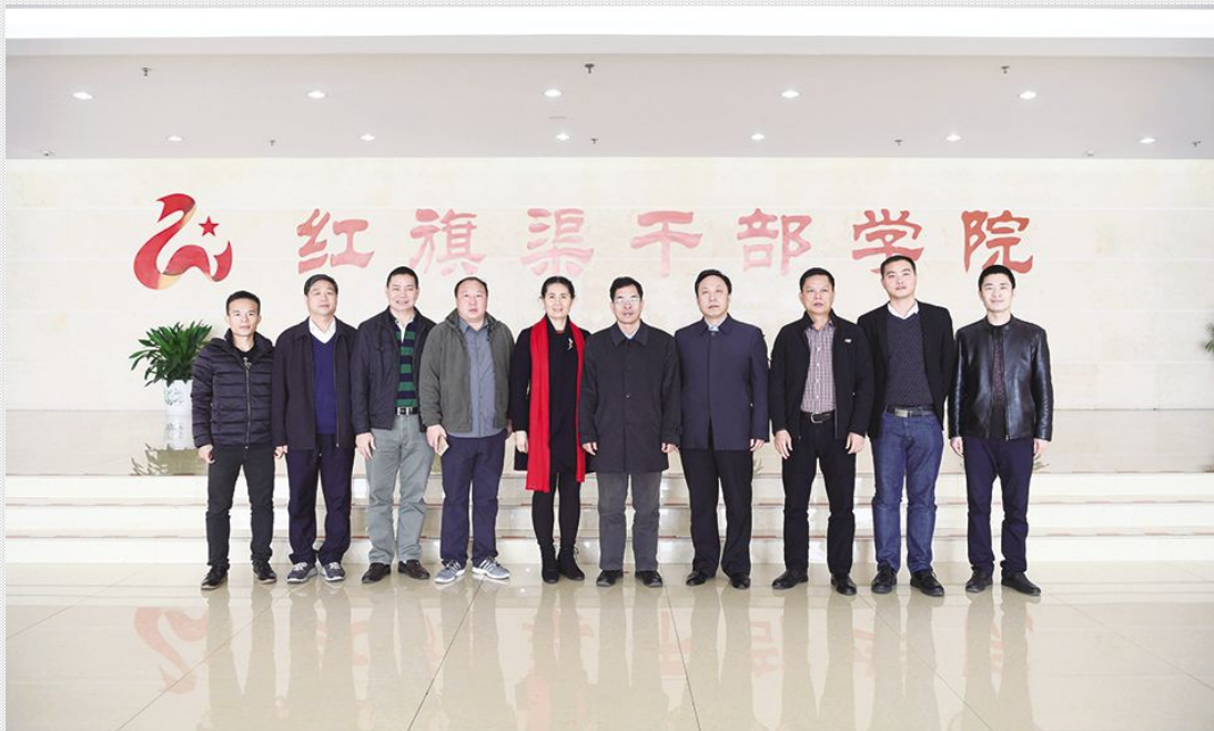
3月21日 广东省湛江市纪委考察组