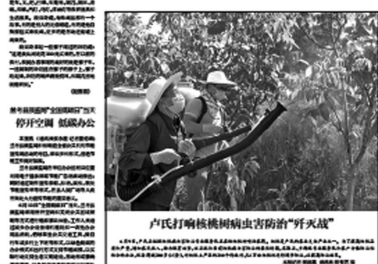
卢氏打响核桃病虫害防治“歼灭战”

“筑梦蓝天,你该去飞翔” 新密一高老师毕业赠言走红网络。新密一高老师毕业赠言走红网络。新密一高老师毕业赠言走红网络。