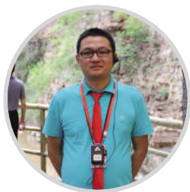
人社部工资福利司副司长 杨晓林

偶尔会看见一些垃圾,我相信肯定不会是我们的老师做的事情,肯定是一些学员们自己扔的。一方面当然是要求我们要加强对学员的一些教育,还有另外一个方面是要求我们老师在发现这些问题的时候,你可能不知道是谁做的,但是当你发现的时候,是不是应该主动地处理一下,来保护、爱护我们如此美丽的一个校园。还有一个就是学院对学员的安排非常周到,但是也应该给学员一些自我管理的机会,毕竟我们是来这里学习的,服务太过周到反而觉得容易忽视学习的整个过程。